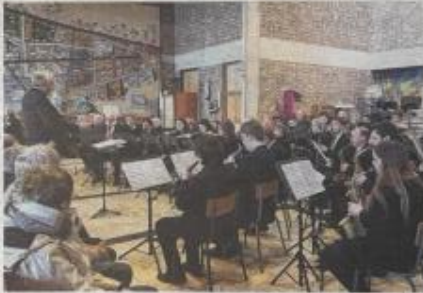
Un concert de Noël très apprécié du public.